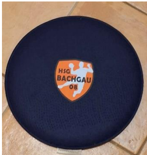
Sitzkissen: 15€ Stück _____