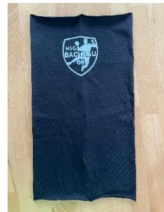
Loop: 7€ Stück _____