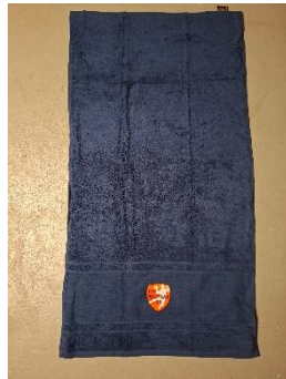
Handtuch: 15€ Stück _____ 50x100 cm