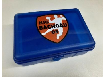
Brotdose: 7€ Stück _____