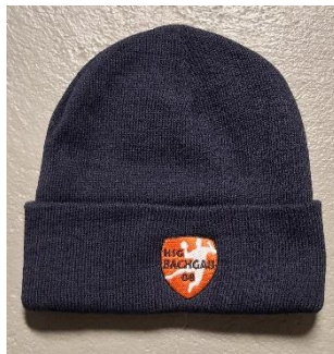
Mützen navy blue: 10€ Stück _____