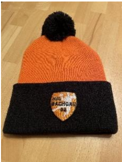
Mütze: 15€ Stück _____