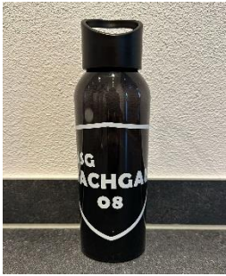
Trinkflasche: 7€ Stück _____